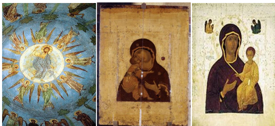
Рис.1. «Вознесение Господне». «Владимирская Богоматерь». «Одигитрия Смоленская»

К концу XVII века относится картина «Парсуна Петра I в детстве» (рис. 2), а к началу этого же столетия относится портрет царя Алексея Михайловича. Если внимательно присмотреться, то одежда как будто на них одна и та же, хотя у Петра и можно уже проследить детские черты на лице. Таким образом, мы находим подтверждение тенденции архаизации в эволюции детской одежды.