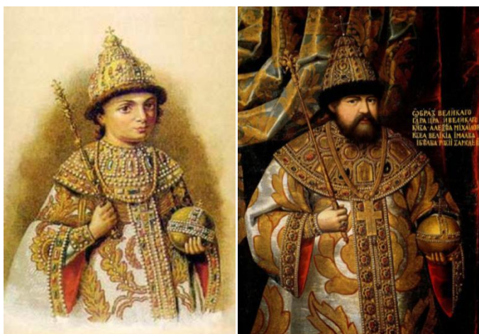
Рис. 2. «Парсуна Петра I в детстве». «Портрет царя Алексея Михайловича»

К концу XVII века относится картина «Парсуна Петра I в детстве» (рис. 2), а к началу этого же столетия относится портрет царя Алексея Михайловича. Если внимательно присмотреться, то одежда как будто на них одна и та же, хотя у Петра и можно уже проследить детские черты на лице. Таким образом, мы находим подтверждение тенденции архаизации в эволюции детской одежды.