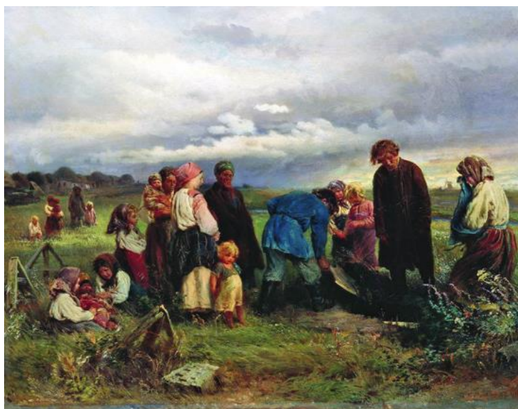
Рис. 5. «Похороны ребенка»

Ф. Арьес писал, что признаком преодоления безразличия к детству служит появление портретов умерших детей. Для Европы это время приходится на XVI век, в России – конец XIX века [3, с.14-21]. Подтверждением может послужить картина К.Е. Маковского «Похороны ребенка» (рис. 5). Здесь мы уже видим, что ребенка хоронят в соответствии с православным обрядом. Стоит отметить женщину справа, которая плачет, горя о потере малыша.