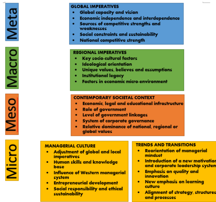
Figure 1. The overall Noosphere model for Asia management

Due to the increasing importance of the influence the company makes on the met level to the environment and the planet, companies pay more and more attention to the sustainability reporting. Moreover, there are created systems such as sustainability management systems. And South Korea is not an exception. In South Korea company social responsibility (CSR) is a very important part of company activity, especially if it has a high influence on the environment. Around the globe metallurgical companies are one of the most harmful for the environment. For that reason, concentrating more attention to the management of these companies on the meta level is extremely important.